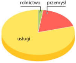
Struktura zatrudnienia we Francji w 2017 r.