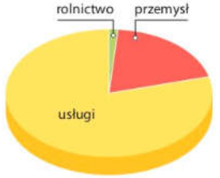
Struktura wytwarzania PKB we Francji w 2017 r.

Produkt krajowy brutto (PKB) – całkowita wartość dóbr i usług wytworzonych w danym państwie w ciągu roku.